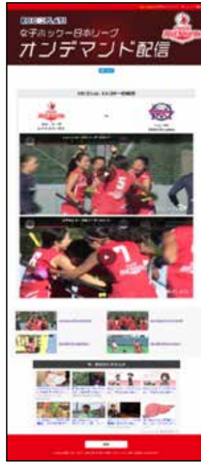
ホッケー 地元リーグ戦