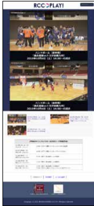
ハンドボール 地元リーグ戦