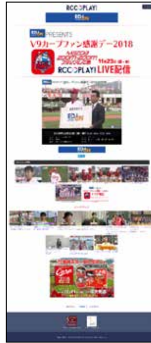
広島カープ ファン感謝デー