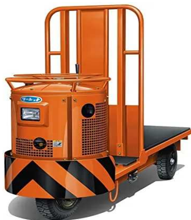
ターレットトラック