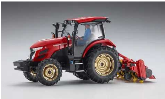
農耕用トラクター