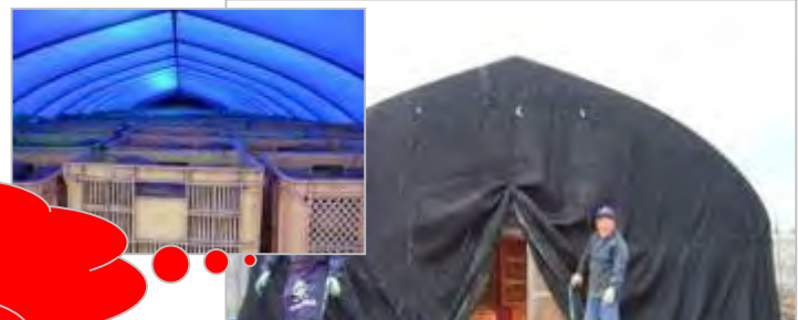
従来型ハウス簡易貯蔵による保管