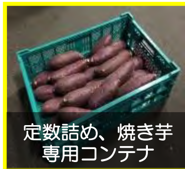
定数詰め、焼き芋 専用コンテナ