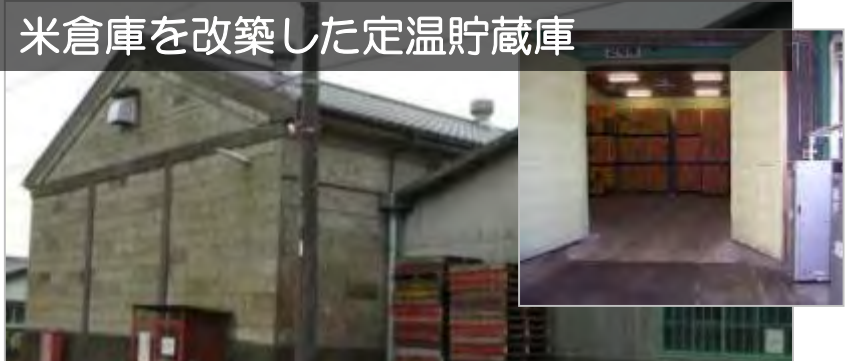
米倉庫を改築した定温貯蔵庫

H17年からキュアリング定温貯蔵庫の建設に着手！ 安定した品質で周年計画出荷が可能となり、価格が安定、規模拡大が実現！