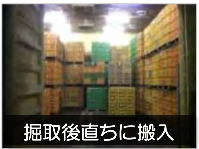
掘取後直ちに搬入