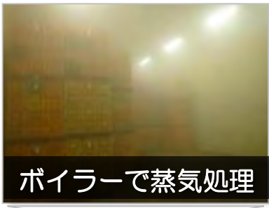
ボイラーで蒸気処理