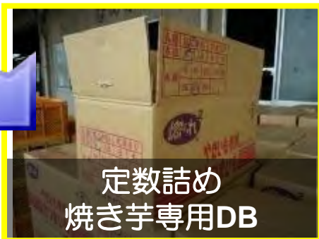
定数詰め 焼き芋専用DB