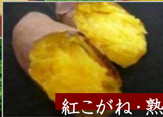
紅こがね・熟成紅こがね