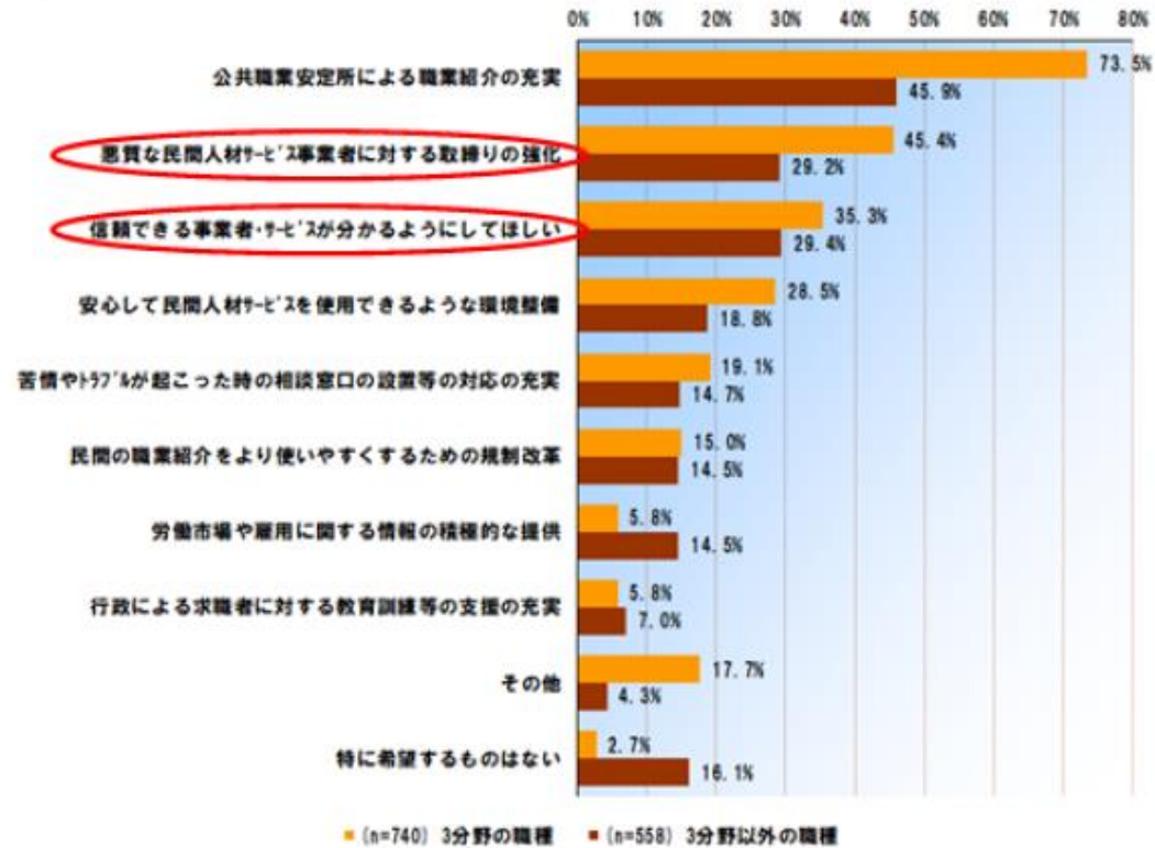
<求人者調査> 国への要望(複数回答)