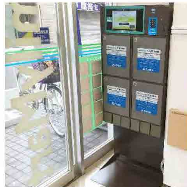
ファミリーマート横浜神之木町店に設置されている受取BOX（KEY STATION）