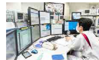
粒子線治療装置と制御室のイメージ