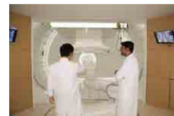
2018年5月よりインドから来日した外国人医師